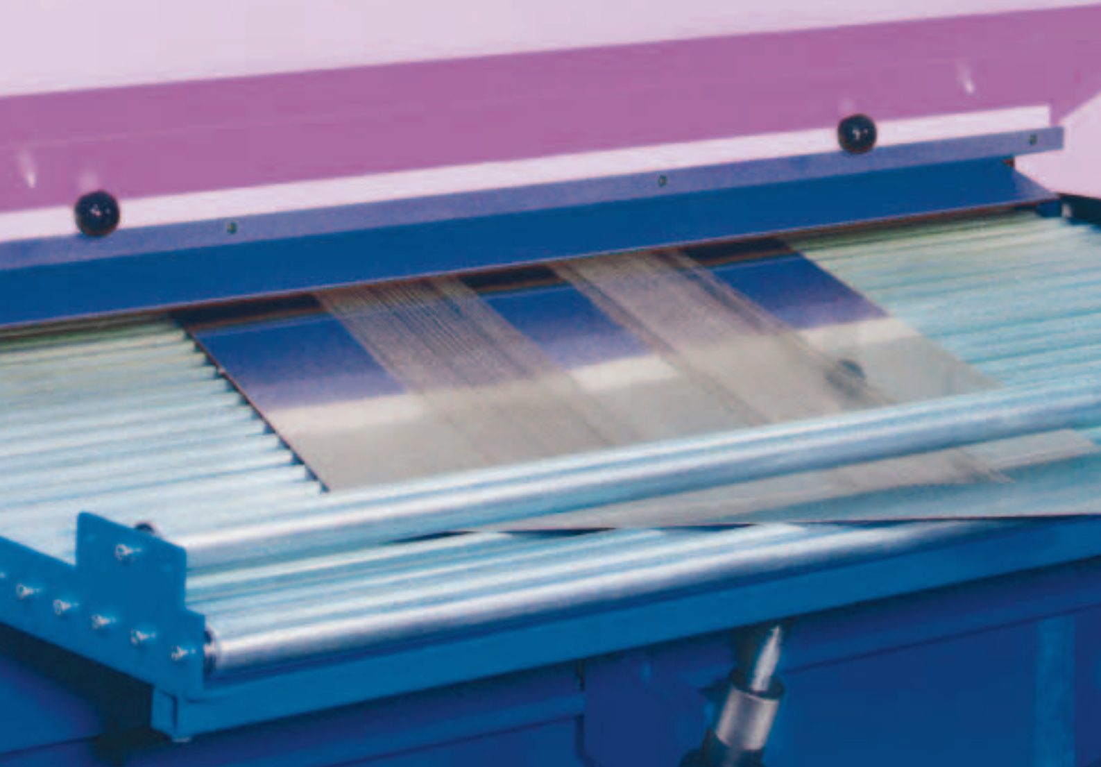
HÄMMERLE Richtwalze TRM 50/1600